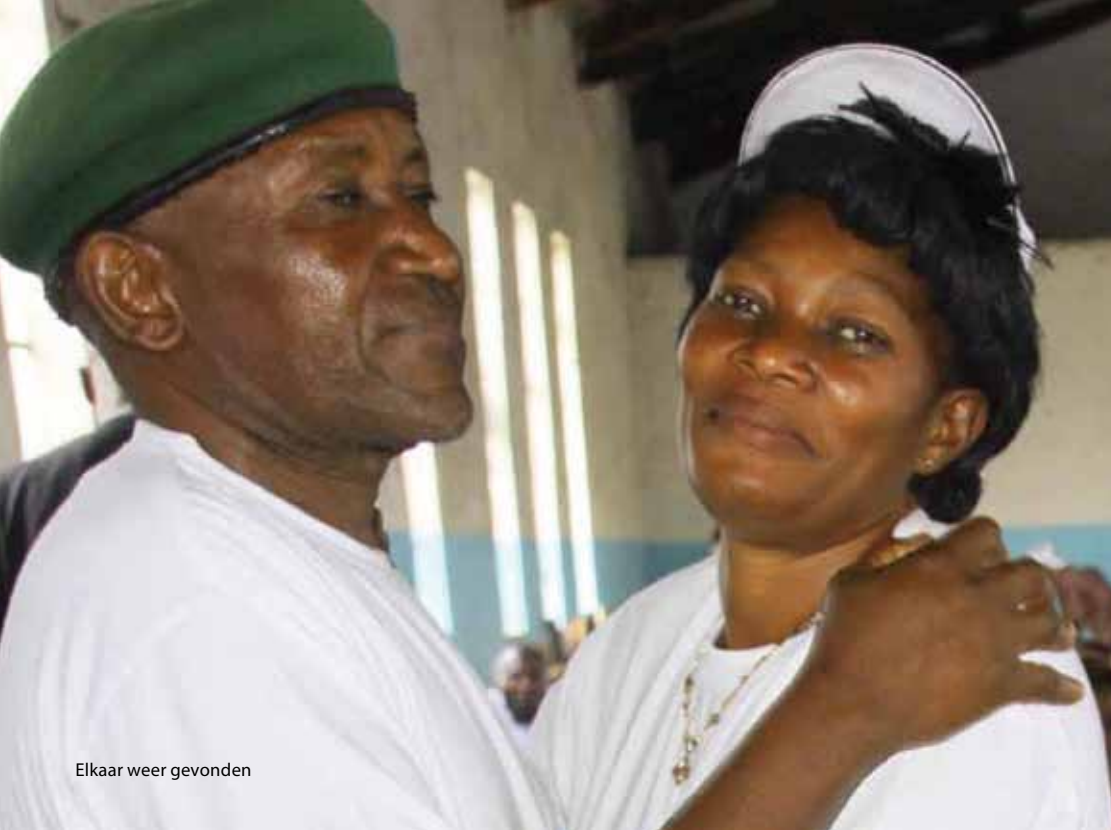
Elkaar weer gevonden

Abby: “Ik vond het eerst moeilijk om mijn manier van leven te veranderen. Mijn vrienden begonnen slecht over mij te praten. Ze zeiden dingen als: ‘Je draagt de last van een ander. Je bent zwak geworden.’ In hun ogen had ik alle waarde in de gemeenschap verloren. Maar toen werd ik geraakt door de ervaring van een andere man, die vergelijkbaar was met de mijne. Zijn vrouw was ook verkracht. Toen hij dat vertelde, voelde ik dat hij de pijn die ik voelde kon begrijpen. Ik realiseerde me dat het tijd was om de controle over mijn leven weer op te pakken en voor mijn gezin te zorgen.”