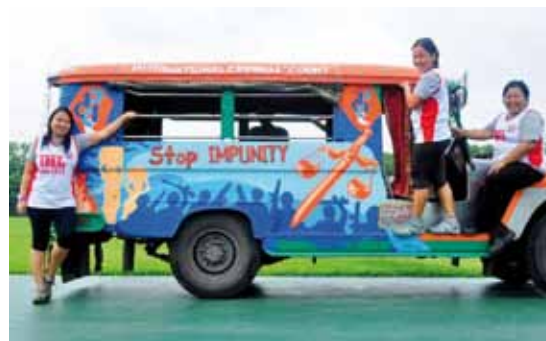
Stop straffeloosheid!

Het Statuut van Rome is het eerste internationale verdrag dat gendercrimes duidelijk omschrijft en vertaalt naar concrete delicten zoals oorlogsmisdaad, genocide en misdaad tegen de menselijkheid. Seksueel geweld kan als misdrijf aangeklaagd worden en het kan tot een veroordeling te komen. Lidstaten die dit statuut mee ondertekend hebben kunnen in eigen land seksueel geweld berechten. Maar het is ook een misdrijf dat de menselijkheid aangaat, dus kan het ook internationaal berecht worden. Dat is een voordeel wanneer het gaat om machtige personen die in hun eigen land niet gemakkelijk berecht kunnen worden, zolang er geen sterke, democratische rechtsstaat is.