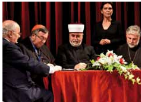
De interreligieuze Raad in Bosnië tekent in juni 2017 een verklaring tegen het stigmatiseren van slachtoffers van verkrachting

Ook vragen de gesprekspartners zich af of mannen in feite ook bang zijn van vrouwen die mannen kunnen bespelen als 'verleidster'. Vrouwen zijn in zekere zin 'zakelijker' dan mannen. Het gebeurt dat vrouwen seksueel verkeer zien als een transactie, iets waardoor ze kunnen overleven en hun vrijheid terug veroveren, wat in oorlogsomstandigheden erg belangrijk is. Zij moeten het niet of althans veel minder hebben van fysiek geweld maar wel van handig optreden, van slim zijn. De kracht en zwakte bij mannen is hun eergevoel, de missie om de groep/stam/gemeen-